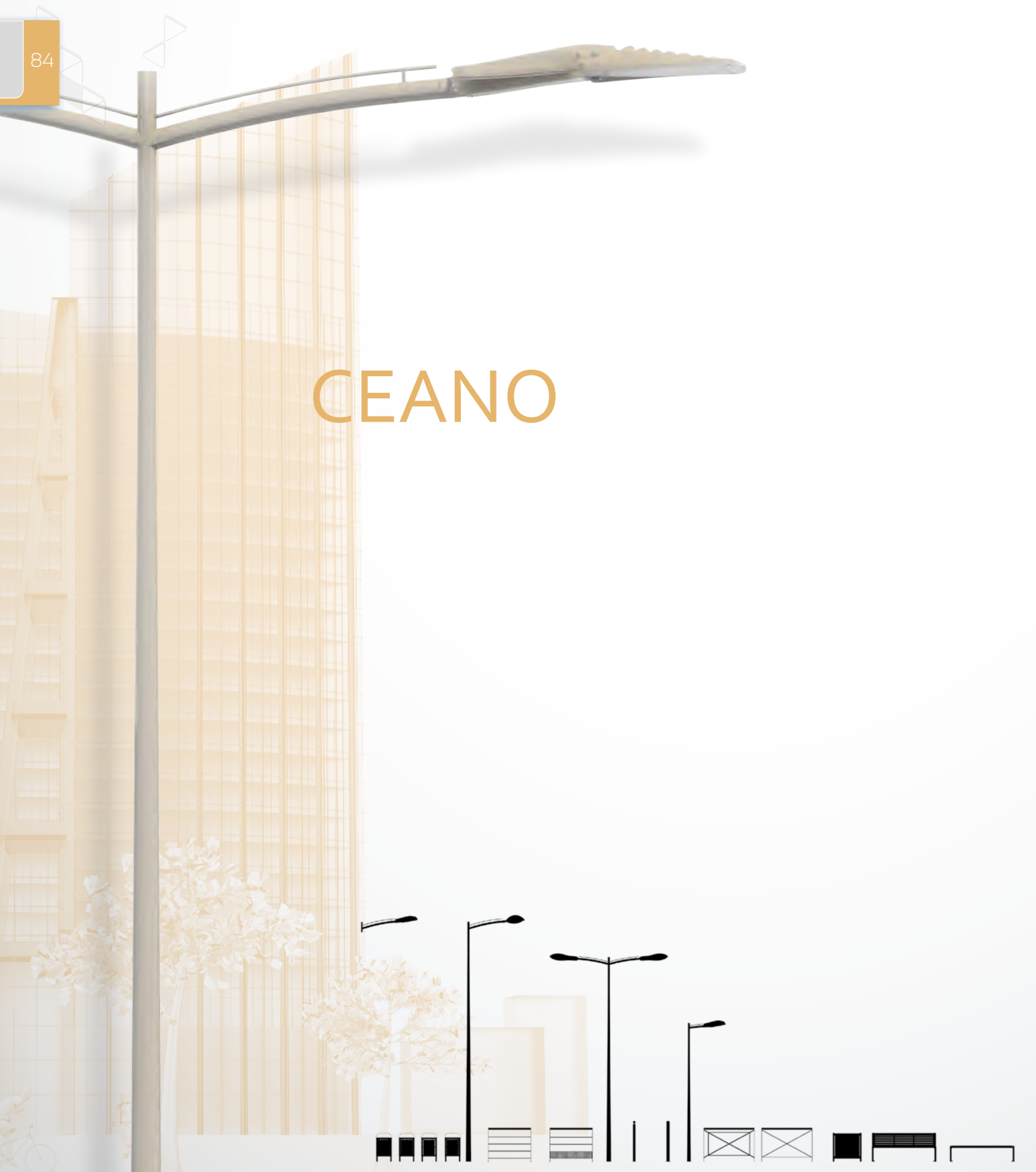
Candélabres de la ligne d'éclairage et de mobilier CEANO